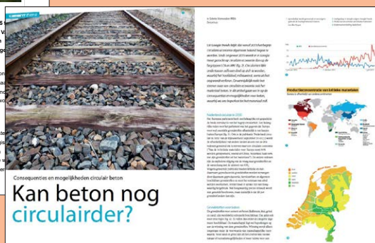
Artikel in Cement