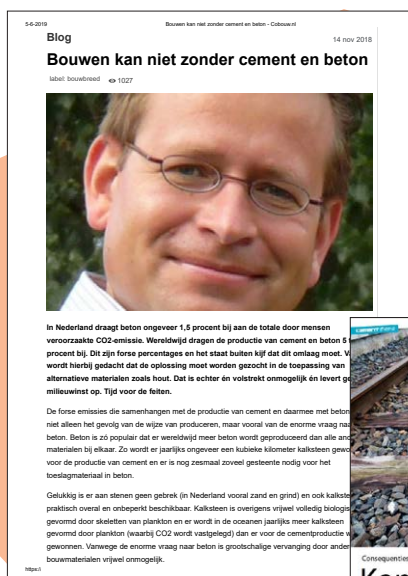
Artikel in Cobouw